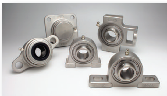
不锈钢轴承组件 耐腐蚀轴承组件系列

FYH 为了满足各种产业及各种使用条件，从小型轻型轴承组件到大型重载荷轴承组件，生产领域广泛。