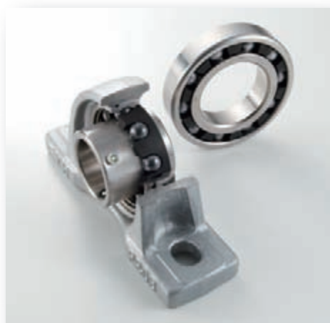
陶瓷球轴承组件 耐热、特殊环境下使用的陶瓷球轴承系列