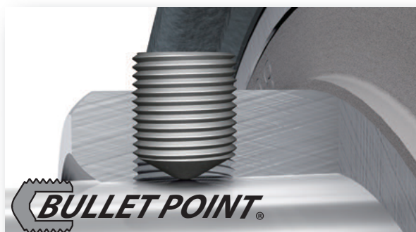
BULLET POINT 振动及高转速使其发挥更强的锁紧性能的独创止动螺钉